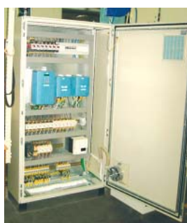
Elskåpet med 690+-drifterna

Wenzels spontana kommentar: "Så enkelt, jag trodde knappt det var sant!"