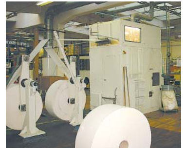
Vy över "Allduksmaskinen"

Förutom att man kan ställa in allt mycket exakt från op-stationen, ges det också möjlighet till presentation av diagnostik, såsom banhastighet, motorströmmar, historik, trip m.m.