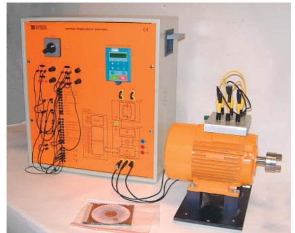
Lab-utrustning med frekvensomriktare 690+

Med "Sensorless" vektor eller vektor med återkoppling, kan 690+ styra standard trefas asynkronmotorer med mycket höga prestanda. Via