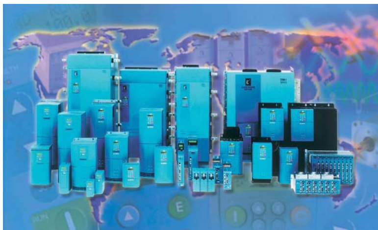
Eurotherm Drives är Englands största tillverkare av produkter och system för varvtals- och momentreglering av elektriska motorer.

Vi vill tacka Invensys och Rick Haythornthwaite för det stöd vi fått under vår tid inom Invensys-koncernen och önska dem lycka till. Avsikten är att bygga vidare på de starka relationer vi har med många företag inom Invensys-koncernen, av vilka flera är kunder